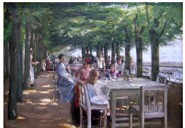
Max Liebermann, Terrasse du restaurant Jacob à Nienstedten sur l'Elbe, 1902, huile, 70 x 100 cm, signé, Hamburger Kunsthalle.